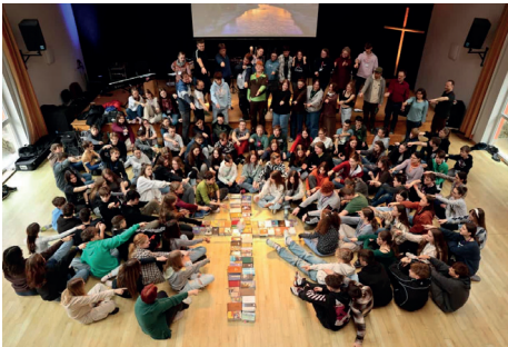
Gruppenbild Rüstzeit 2024

Vom 5.-10. Februar 2026 fahren die Konfirmandinnen und Konfirmanden unserer Region gemeinsam mit Jugendlichen anderer Orte zur Konfirmanden-Rüstzeit in die Strobelmühle nach Pockau. Veranstalter der Rüstzeit ist die Evangelische Jugend im Kirchenbezirk Annaberg. Unterstützt werden wir dabei von vielen Mitarbeitern aus den (Jungen) Gemeinden. Vielen herzlichen Dank dafür!